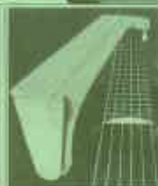
Alu-Einlagen garantieren ewige Formbeständigkeit des Halses –